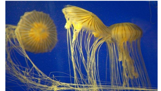
Le continent sous-marin est toujours terra incognita et David Wahl en donne à voir la réalité.

"La vie profonde" de David Wahl : voyage en compagnie des explorateurs d'abysses océaniques