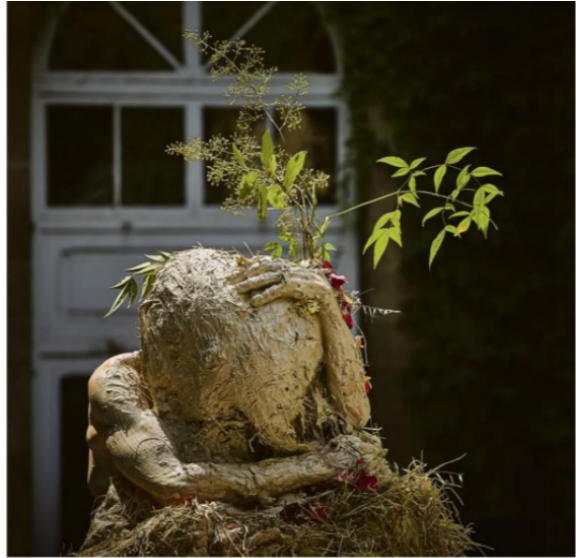
transformer le conteur en homme de pierre.